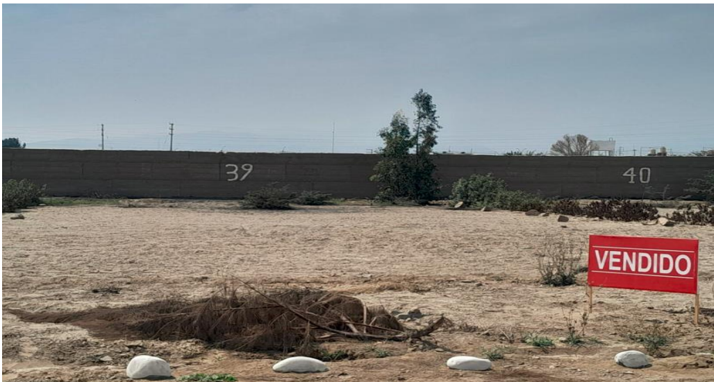
1 SUB LOTE 40, CONDOMINIO ANDORRA DESOCUPADO