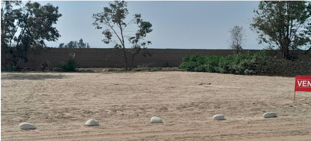
1 SUB LOTE 10, CONDOMINIO ANDORRA DESOCUPADO