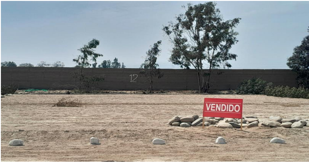
1 SUB LOTE 36, CONDOMINIO ANDORRA DESOCUPADO