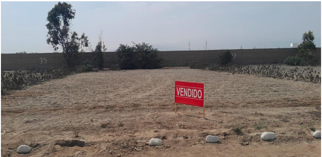
1 SUB LOTE 37, CONDOMINIO ANDORRA DESOCUPADO